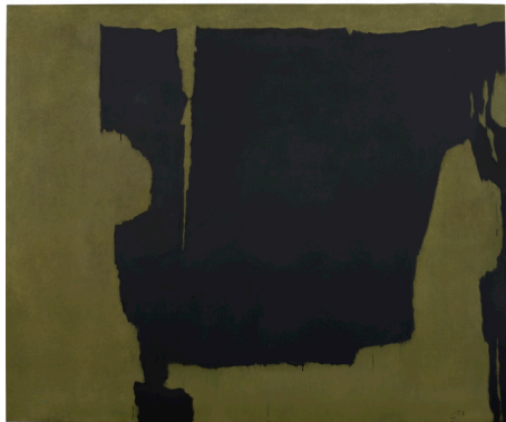
Charles Pollock, Untitled [Black] yellow-green , huile sur toile, 151,5 x 180,5 cm, 1962