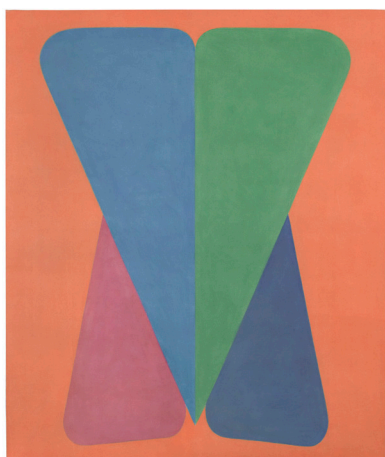
Charles Pollock, Second Voice , Acrylique sur toile, 152,5 x 127 cm, 1965