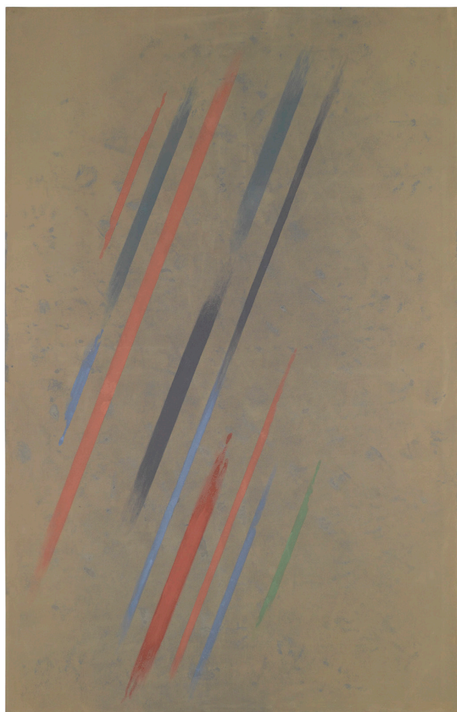
Charles Pollock, NY43a , Acrylique sur toile, 238,5 x 152 cm, 1970

En 1945, il passe trois mois à peindre et à dessiner dans le désert de l'Arizona. Cette expérience marque un tournant dans sa carrière : il abandonne le Réalisme social et s'engage dans l'abstraction.