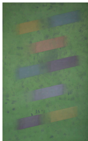
Charles Pollock, NY29 , Acrylique sur toile, 238,5 x 152 cm, 1969