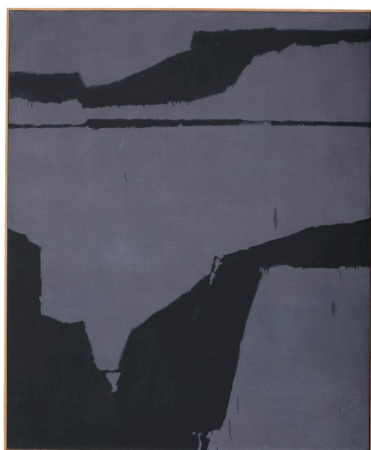
Charles Pollock, Rome Six , Huile sur toile, 170 x 140 cm, 1963