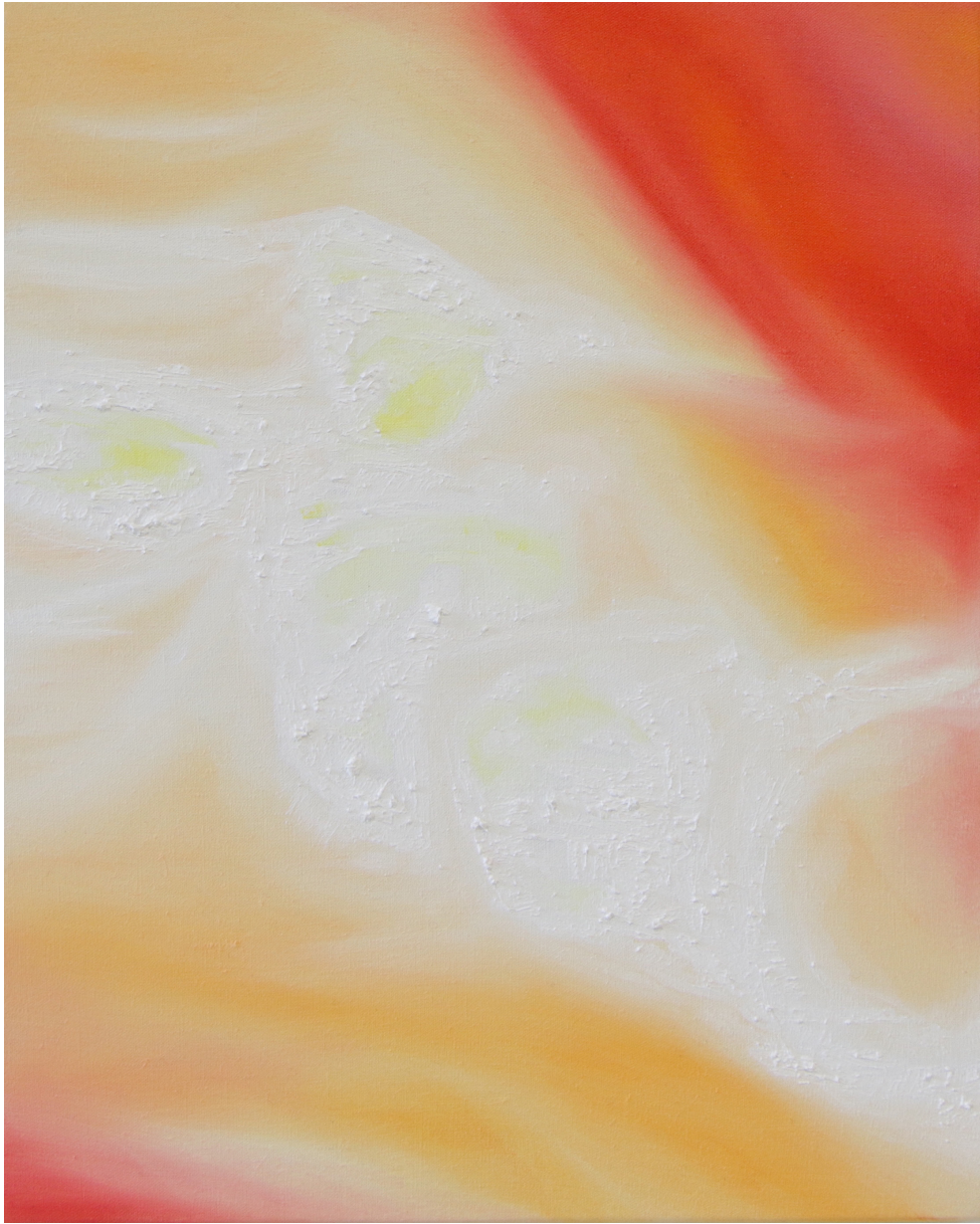
LISA OUAKIL Jour , 2024 Huile sur toile 46 x 38 cm © Lisa Ouakil