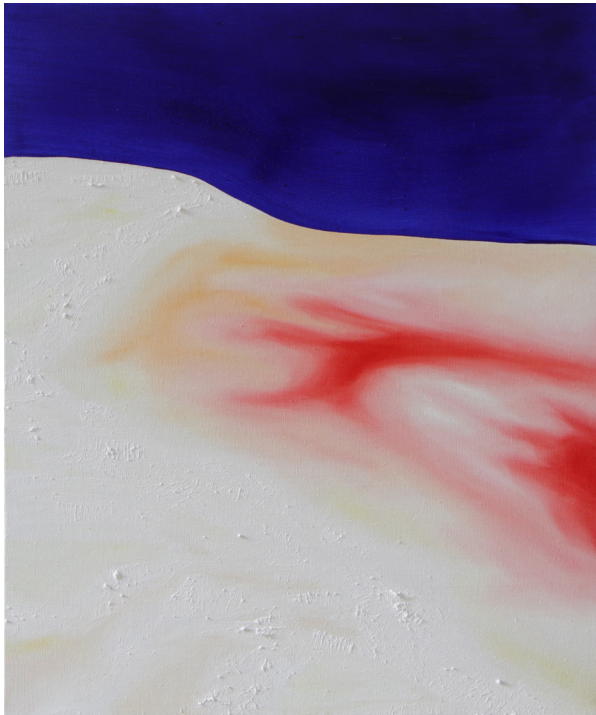
Sleeping beauty, 2023