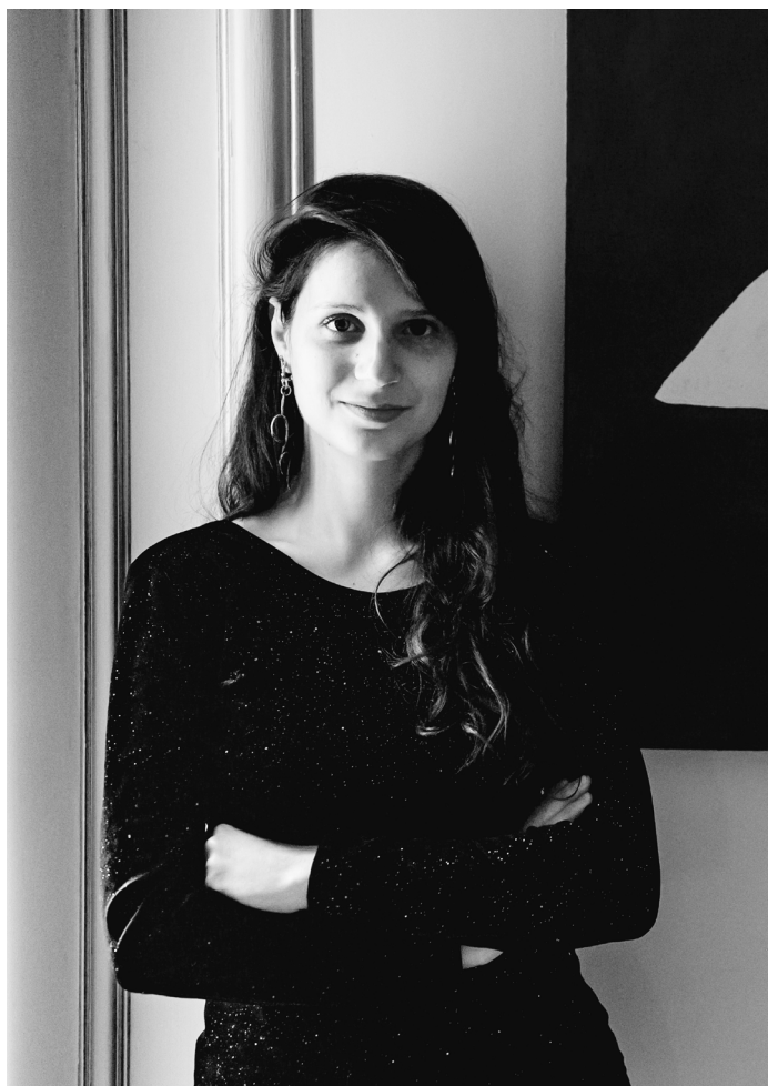
Portrait de l'artiste

Actuellement en résidence à Poush Aubervilliers.