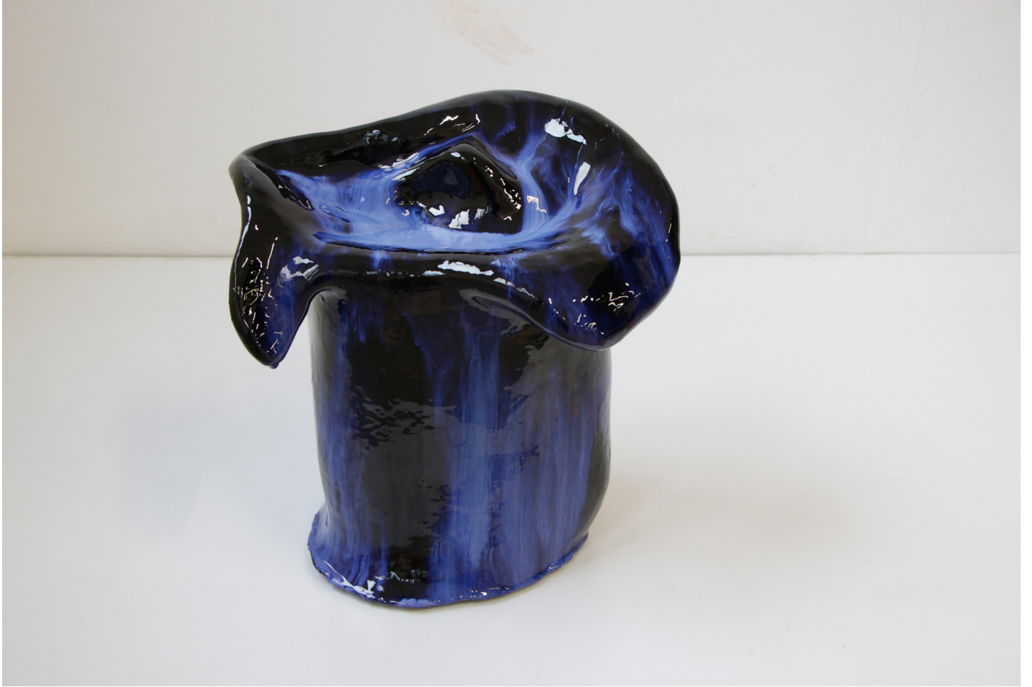
LISA OUAKIL Maria lunaires, 2022 Terre cuite et émail 33 x 21,5 x 38 cm © Lisa Ouakil