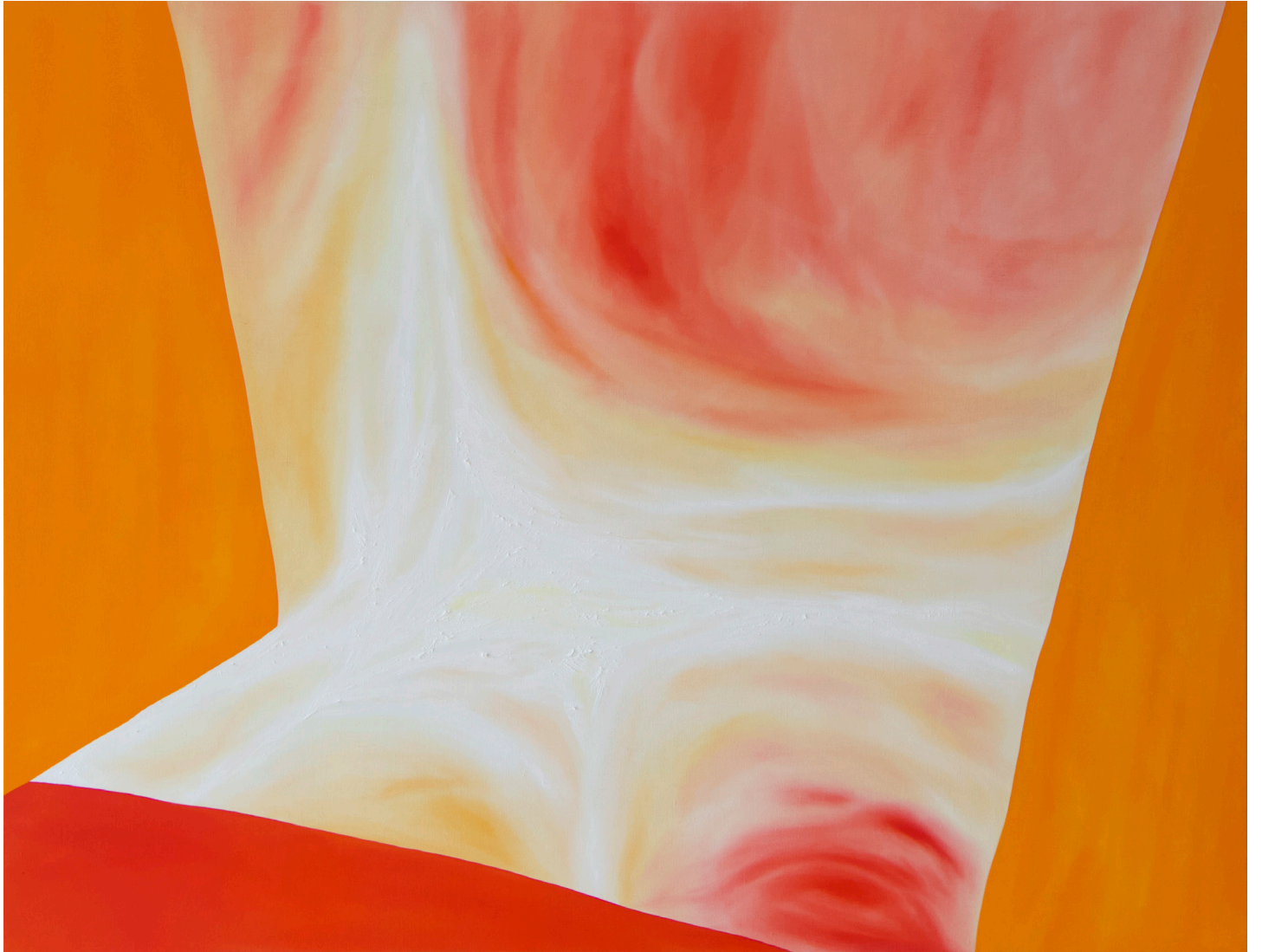
LISA OUAKIL Altabella , 2024 Huile sur toile 89 x 116 cm © Lisa Ouakil