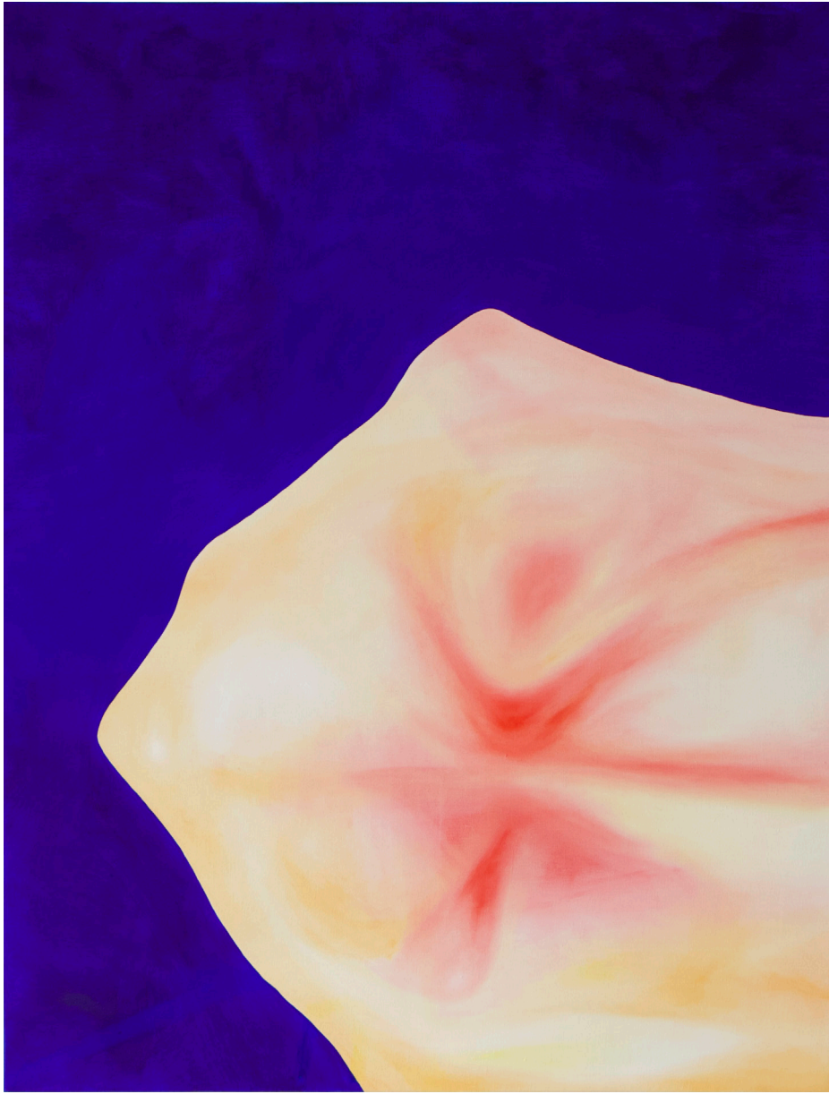
LISA OUAKIL La Danseuse , 2023 Huile sur toile 116 x 89 cm © Lisa Ouakil