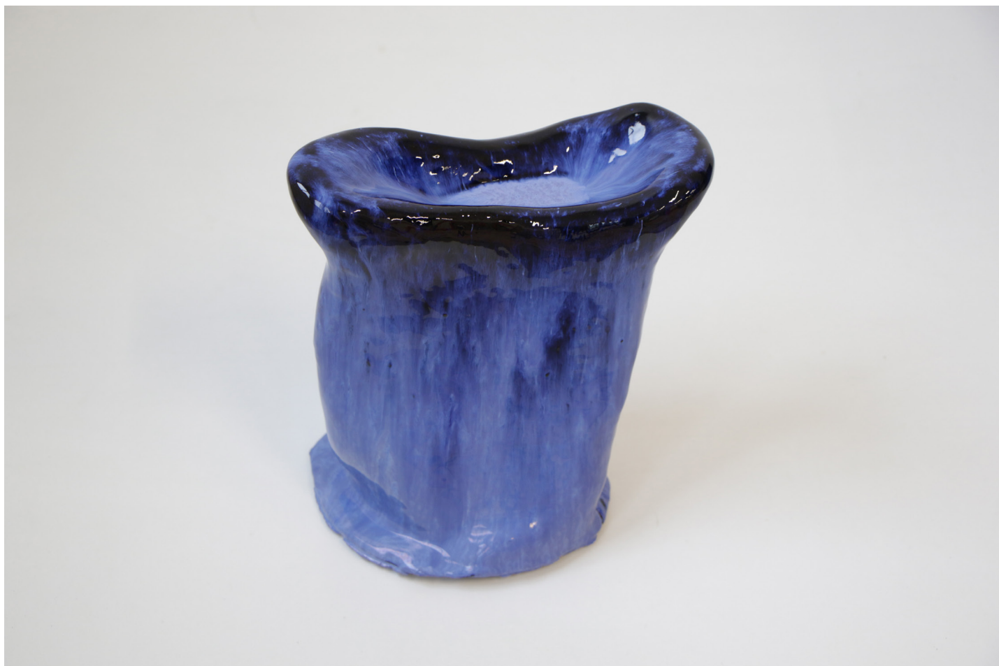
LISA OUAKIL Lattimi lunare III , 2023 Terre cuite et émail 23 x 23 x 9 cm © Lisa Ouakil