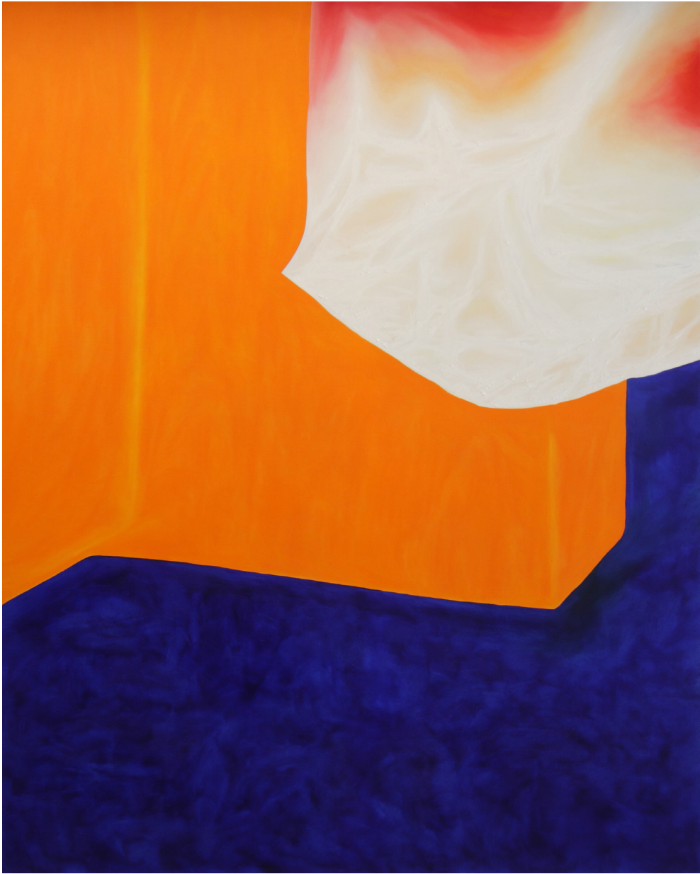
LISA OUAKIL Palazzo del sole , 2024 Huile sur toile 162 x 130 cm © Lisa Ouakil